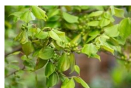
天台烏薬（テンダイウヤク）

今回のリニューアルで新しく配合したのは、和歌山県新宮市産の天台烏薬（テンダイウヤク）の葉から開発したテンダイウヤク葉エキス（保湿成分）と、三重県熊野市の新種の柑橘である完熟の新姫（ニイヒメ）の果皮から開発した新姫エキス/シトルス（タチバナ/レチクラタ）果皮エキス（保湿成分）。国産の植物の未知なるチカラを発見し、化粧品に配合できる成分として開発に成功するまでに約7年を費やしています。また、「セルグレース デュプレ クリーム」に配合しているクミスクチンエキス/オルトシホンスタミネウスエキス（保湿成分）も配合。従来から「セルグレース」に配合しているオリジナルの植物成分のシマホオズキ果実エキス（保湿成分）に加えることで、さらなる力を発揮することが期待できます。当社は、90年前の創業時から研究部門を持ち、多くのオリジナル成分を開発してきたことにより、オリジナリティの高い製品開発を実現してきました。6品それぞれのアイテムには、目的を果たすためのそれぞれの成分を配合。配合技術の高さが、効果を支えます。